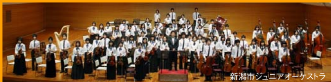
新潟市ジュニアオーケストラ